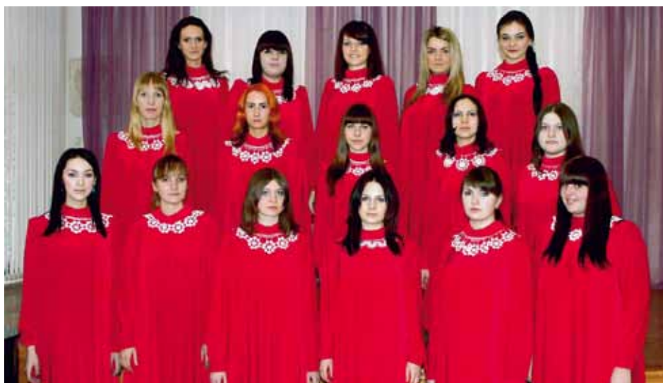
DHETSKY KHOR SKOLI 63. NIZHNY NOVGOROD Nizhny Novgorod, Russia