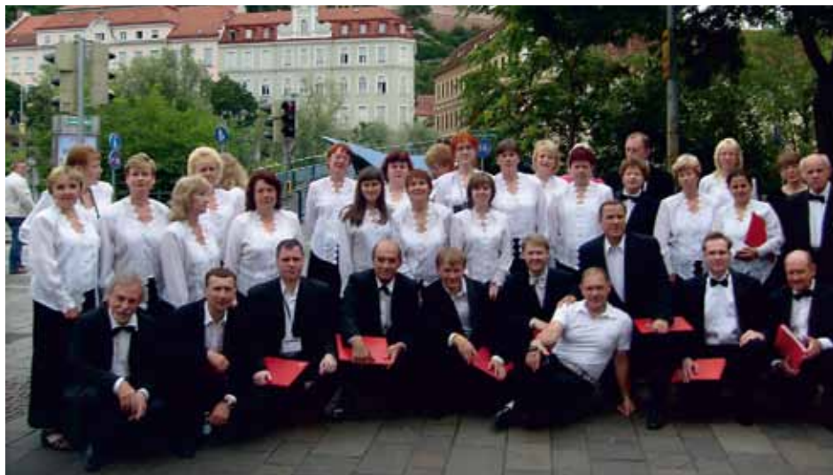
ACADEMIC CHOIR "VIVAT" Nizhny Novgorod, Russia