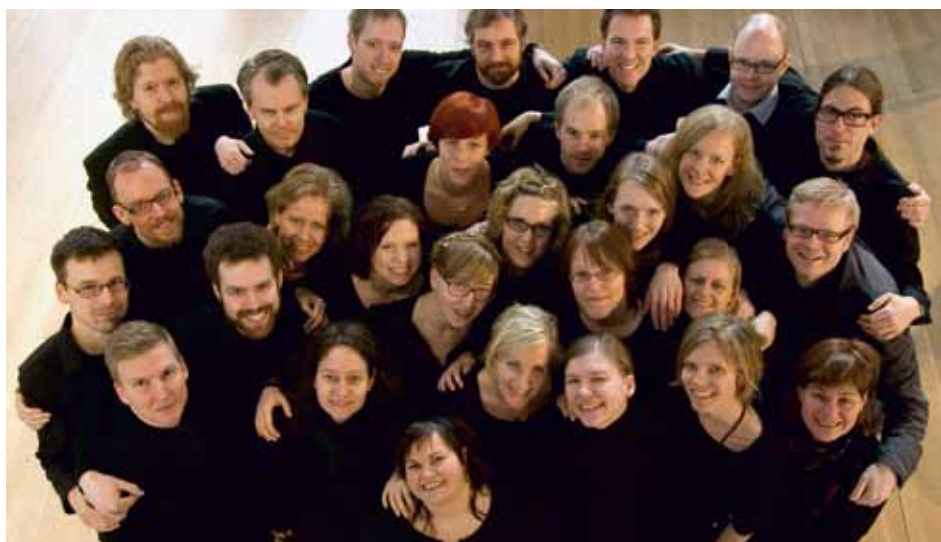
HAGA MOTETTKÖR Göteborg, Sweden