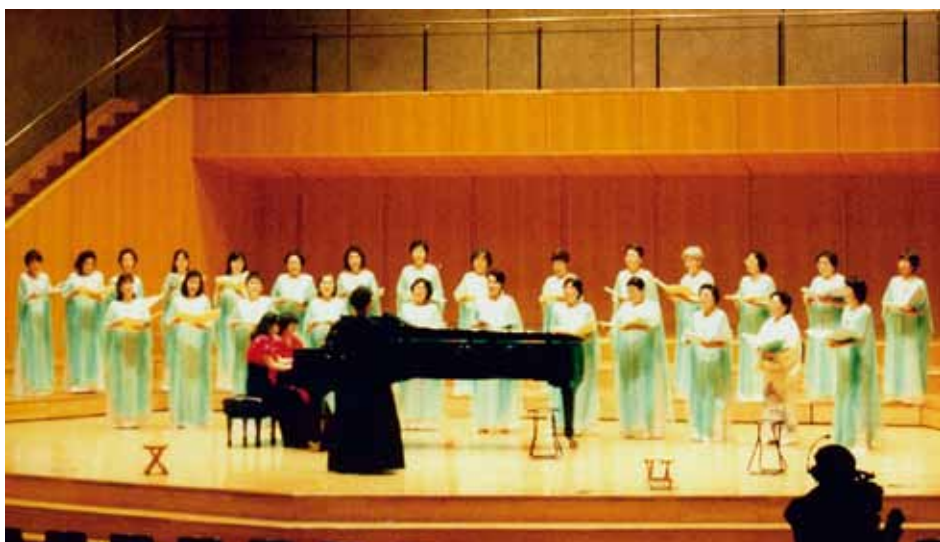
ENSEMBLE "MIMOSA" Tokyo, Japan