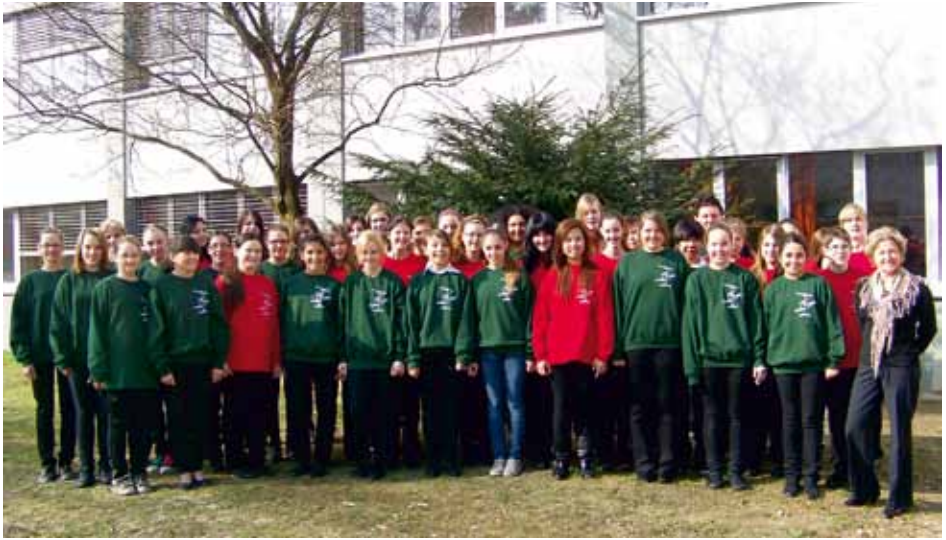
BINDERMICHLER SCHULSPATZEN Linz, Austria