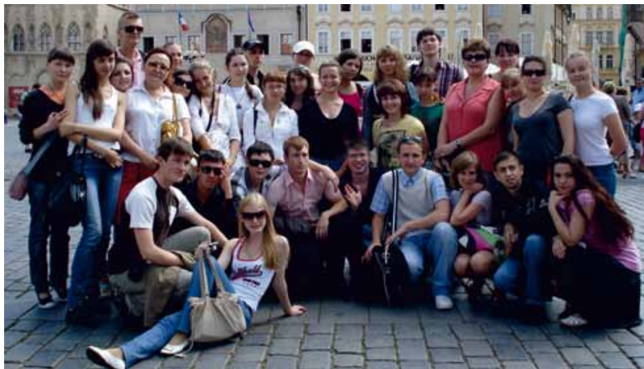
STUDENTS' CONCERT CHOIR OF THE URAL STATE MEDICAL ACADEMY Ekaterinenburg, Russia