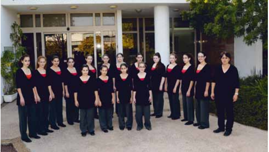
TZLIL CHOIR Upper Galilee, Israel