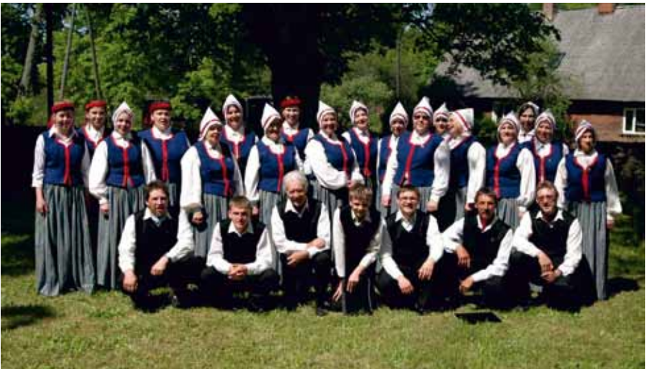
SKULTE Skulte civil parish, Skulte Civil Parish, Latvia