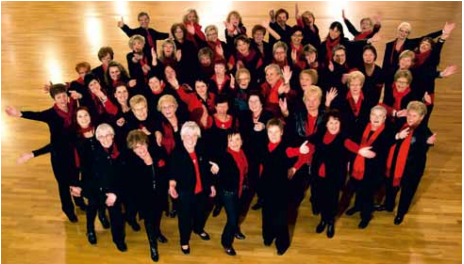
FRAUENCHOR EISBORN Balve, Germany