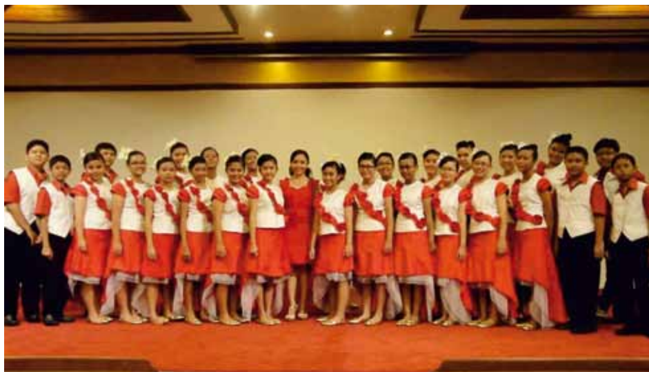
PANGUDI LUHUR YOUTH CHOIR Jakarta, Selatan, Indonesia