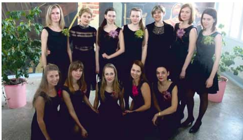
VYPUSKNIKI Moscow, Russia