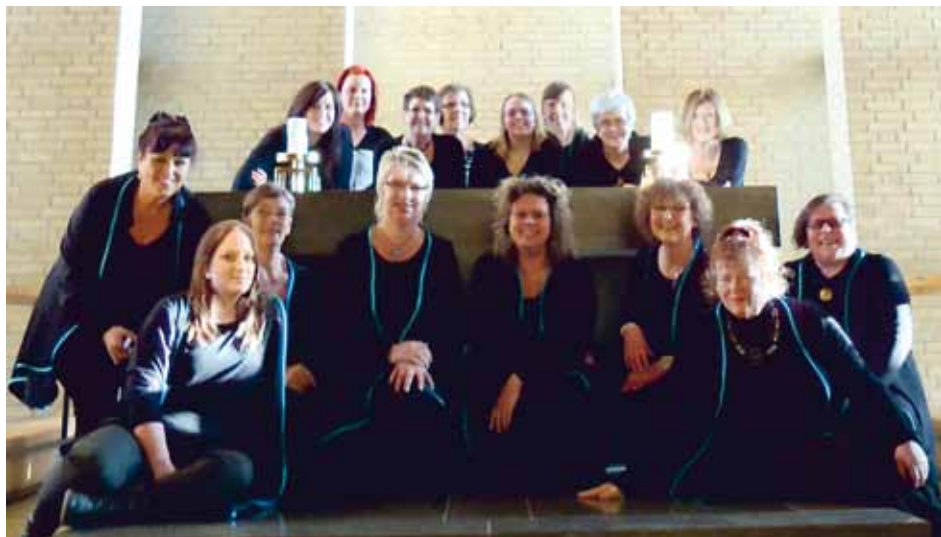
GOSPEL 2 YOU Kalundborg, Denmark