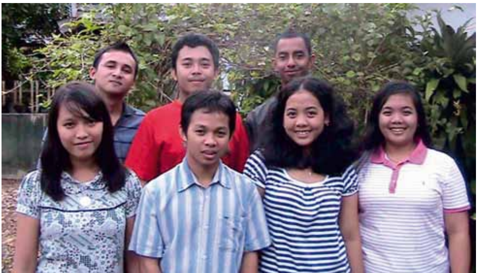
PURNA GITA BAHANA NUSANTARA BANJARBARU Banjarbaru, Indonesia