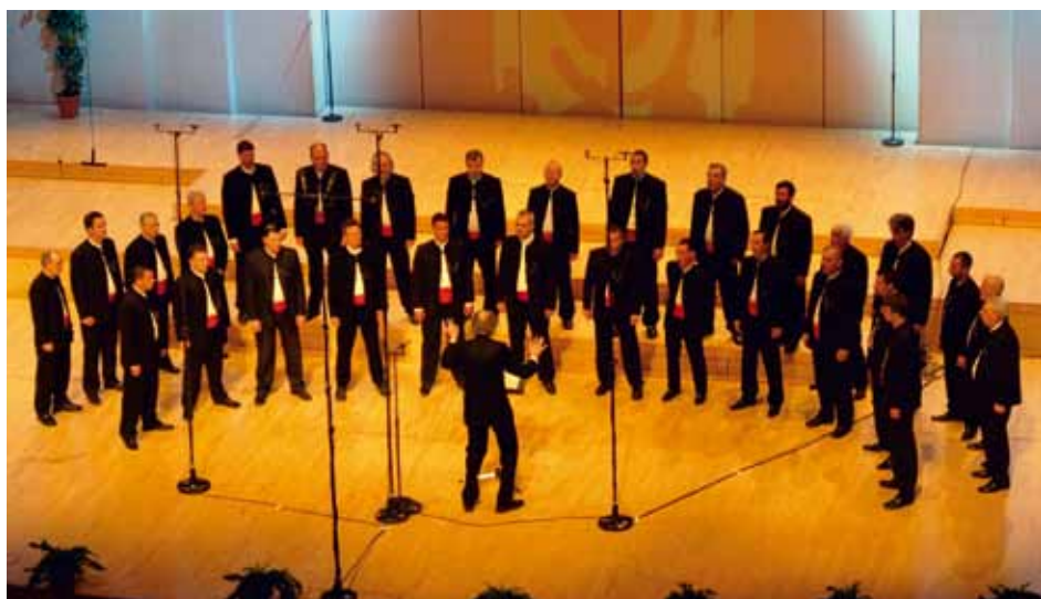
GRADSKI ZBOR "BRODOSPLIT" Split, Croatia