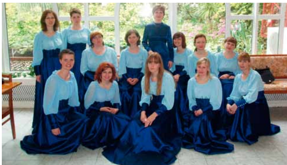
KANTILENA Ramenskoe, Russia