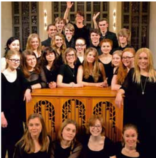
HÄGERSTENS UNGDOMS KÖR Hägersten, Sweden