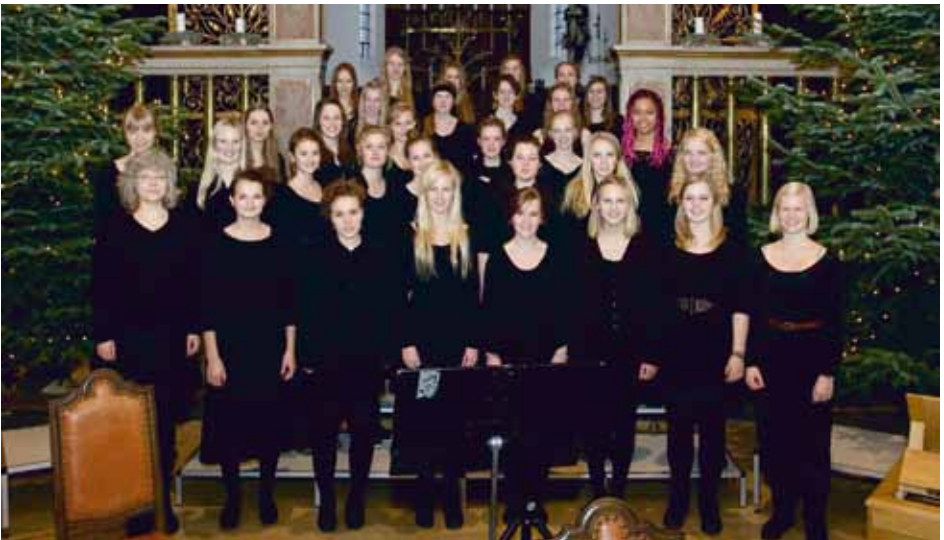
DET JYSKE MUSIKKONSERVATORIUMS PIGE KOR Aarhus, Denmark