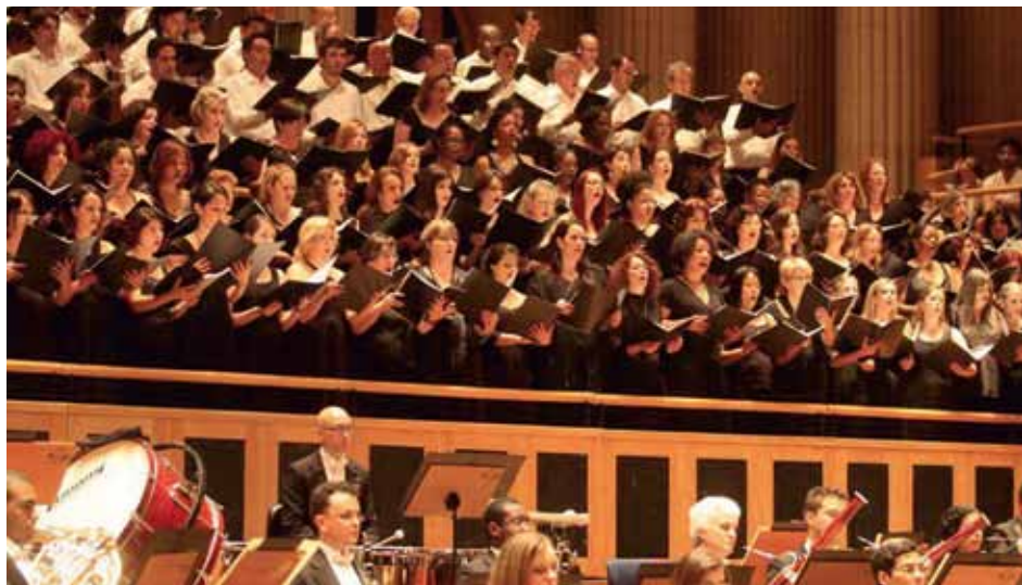
CORAL AZUL São Paulo, Brazil