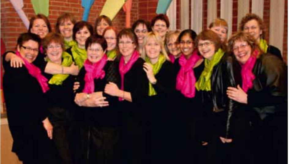
KVINDEKORET CRESCENDO Horsens, Denmark