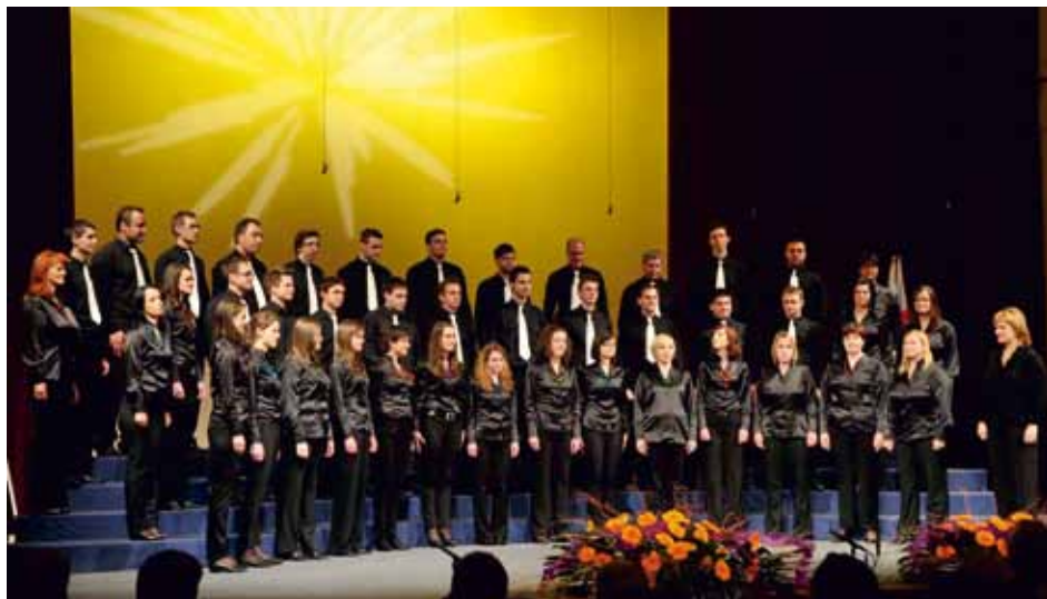
ODMEV MEŠANI PEVSKI ZBOR KAMNIK Kamnik, Slovenia