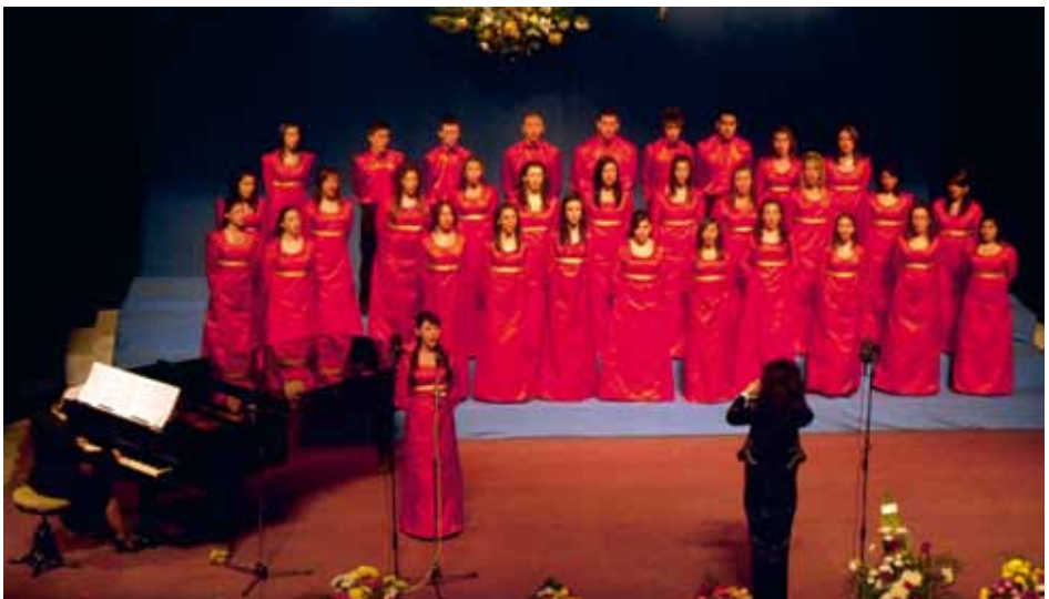
REPRESENTATIVE SCHOOL MIXED CHOIR "SAVA DOBROPLODNI" Shumen, Bulgaria