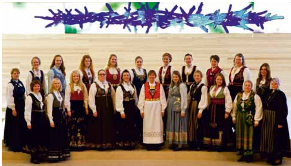
OSLO VOCALIS Våler, Norway