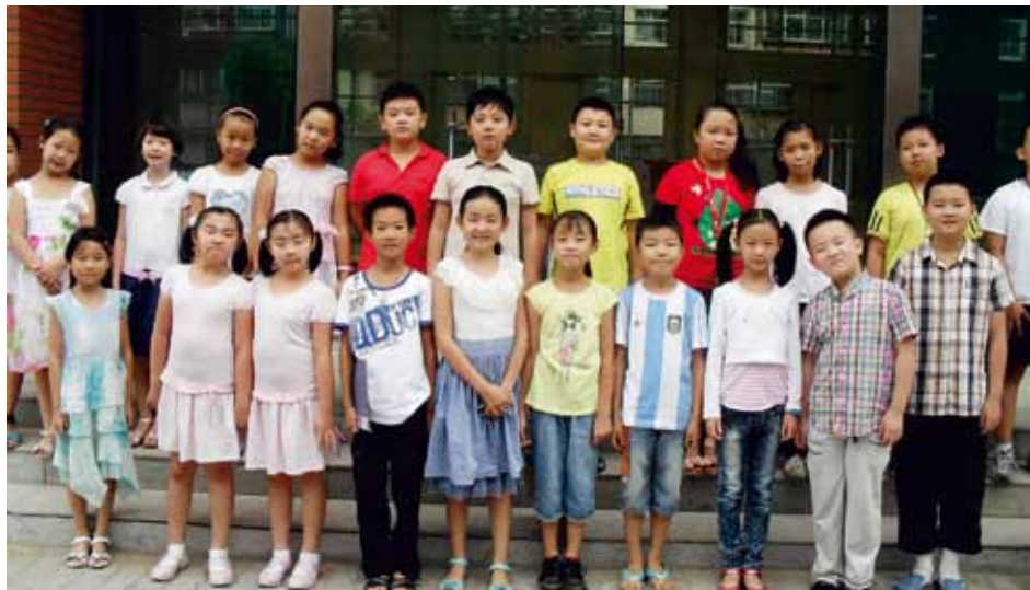
NING XIA NO. 21 SING GROUP Yinchuan, NingXia, China