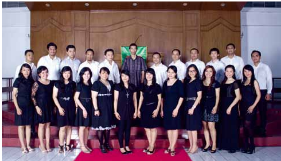
JAKARTA CHAMBER SINGERS Jakarta, Indonesia