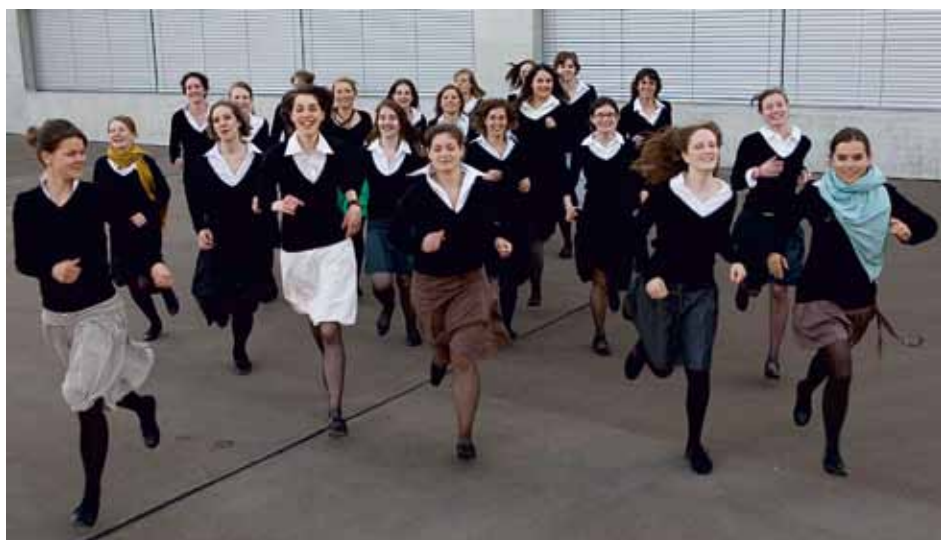
LES CHANTILLES Winterthur, Switzerland

Director / Conductor : Andre Pinheiro de Souza