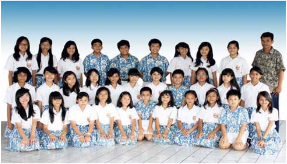
MARSUDIRINI CHILDREN'S CHOIR Bekasi, Indonesia