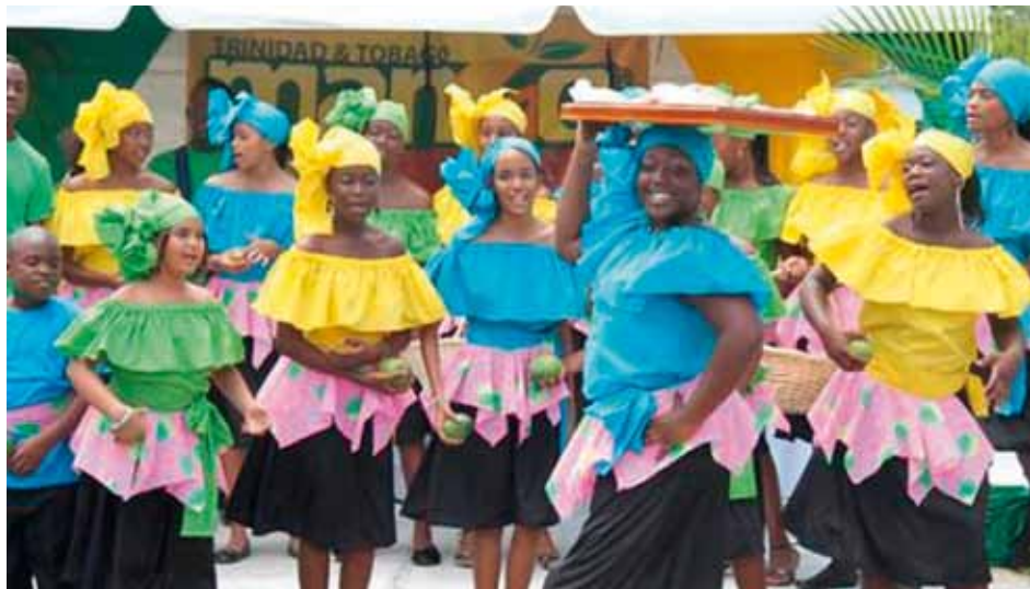
HUMAN DEVELOPMENT FOUNDATION Wood Brook, Port of Spain, Trinidad and Tobago