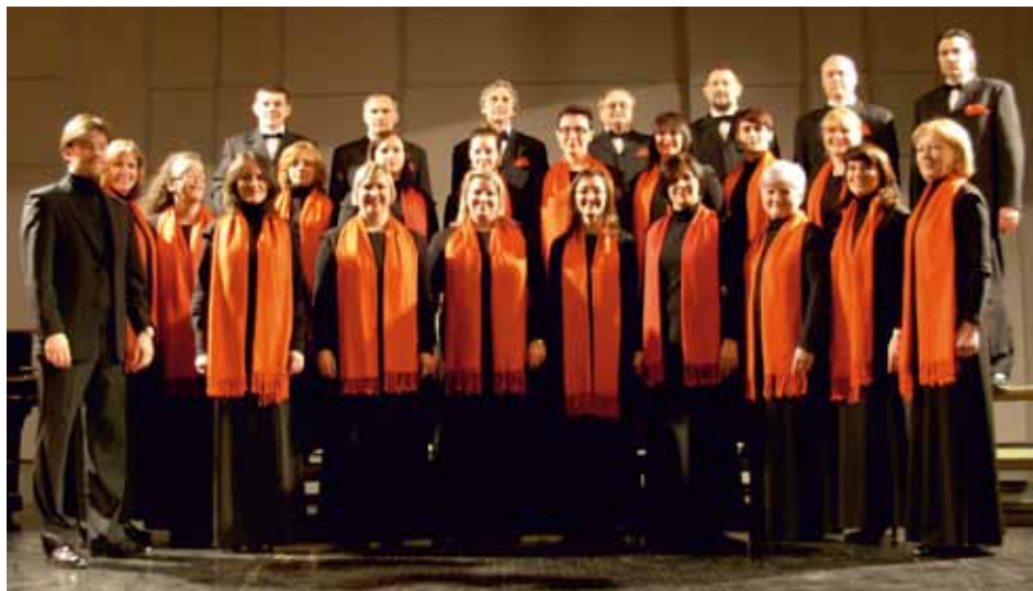
CHORUS CARLOSTADIEN Karlovac, Croatia