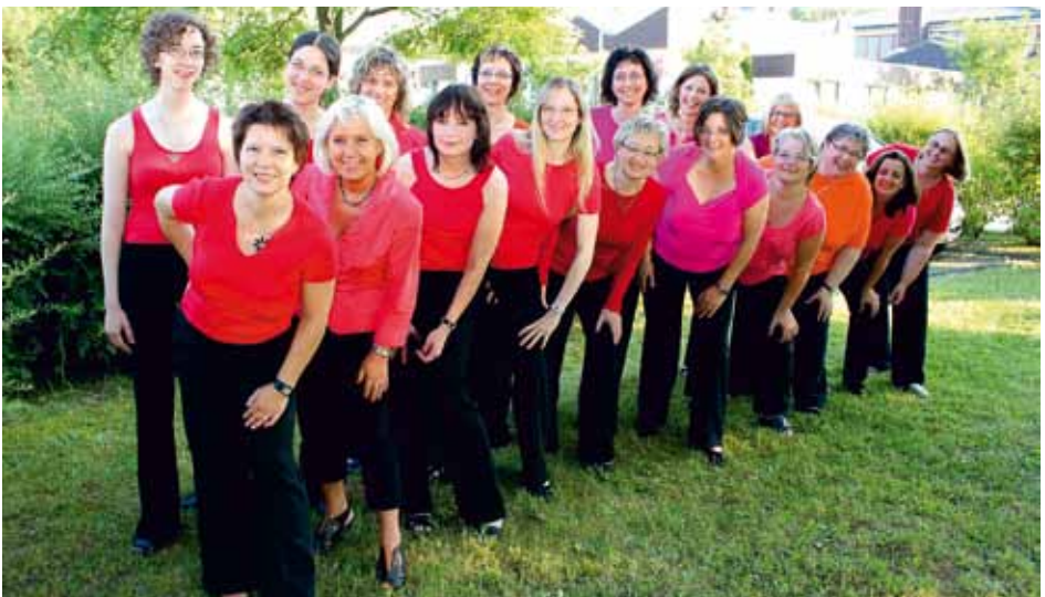
KAMMERCHOR BELLE CANTO Marpingen, Germany