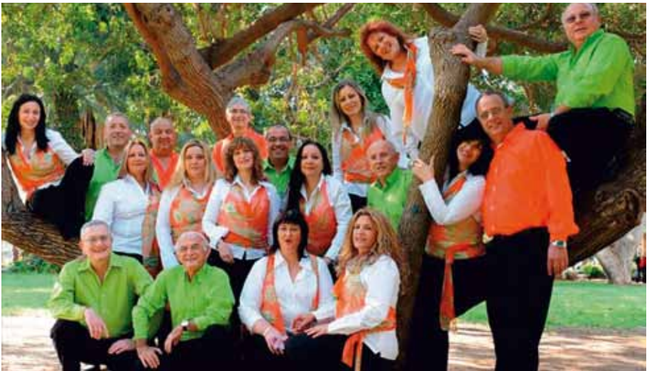
CHOIR KRAMIM Rishon Le Zion, Israel