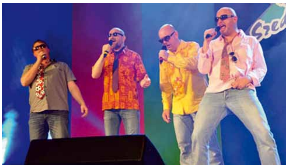
MALE MALICE Ljubljana, Slovenia