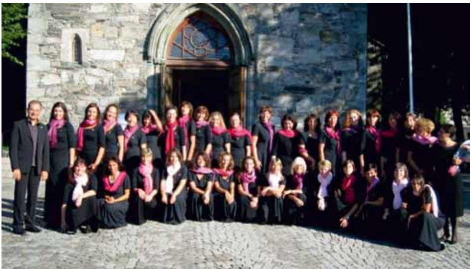
MULTIFARIAM Ruda, Italy