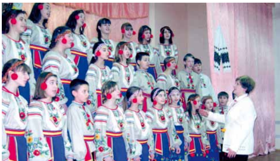
SHKOLNY KORABL Kiev, Ukraine