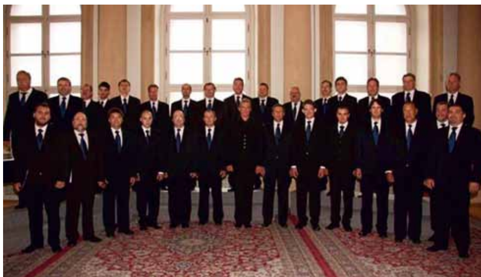
DRUŠTVO PEVSKI ZBOR SREČKO KOSOVEĻ AJDCUŠČINA Ajdčuščina, Slovenia