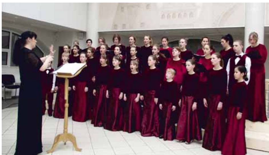
CHILDREN'S CHOIR "PODSNEZHNIK" Dubna, Russia