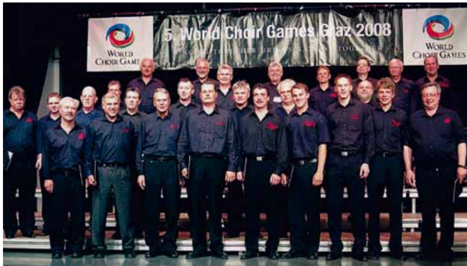
CAMERATA VOCALE Schönau, Germany