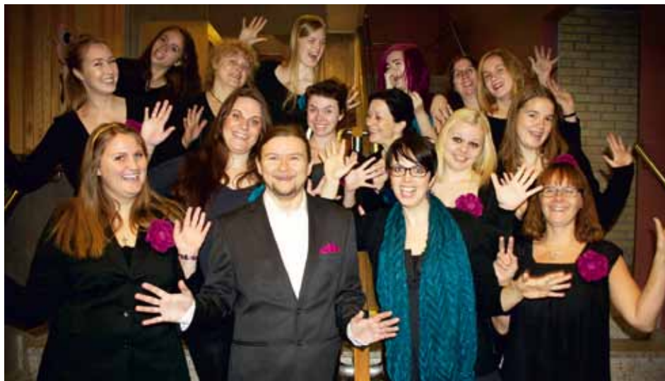
AVESTA MUSIKSKOLAS K R Hedemora, Sweden