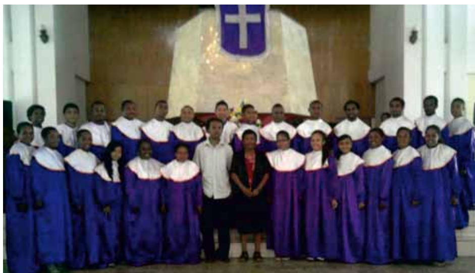
THE HOPE VOICE CHOIR Jayapura of Papua, Indonesia