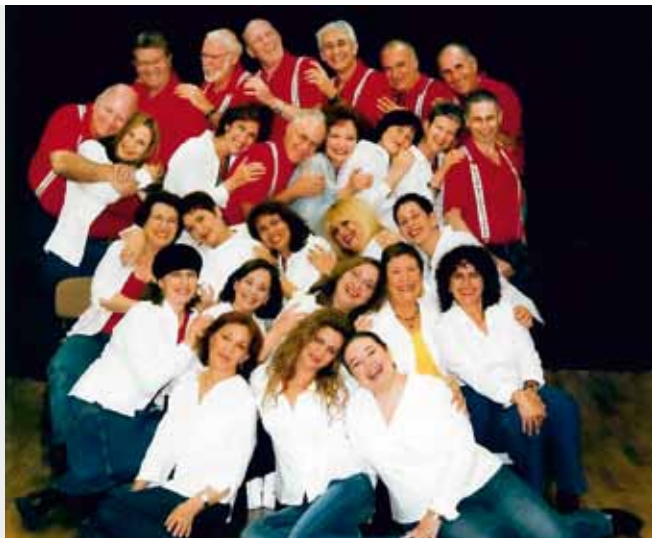
JEAN'S Kfar Sava, Israel