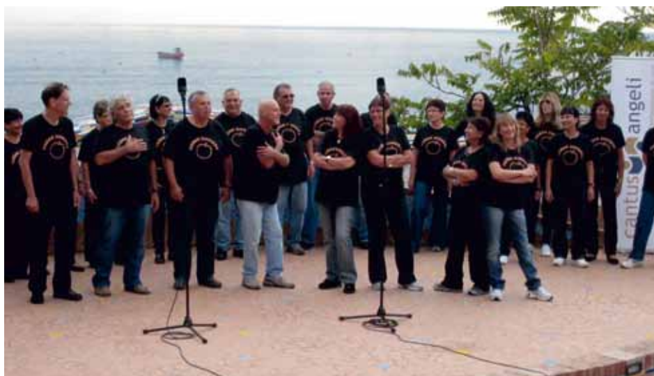
HADAR SINGERS Tel Aviv, Israel