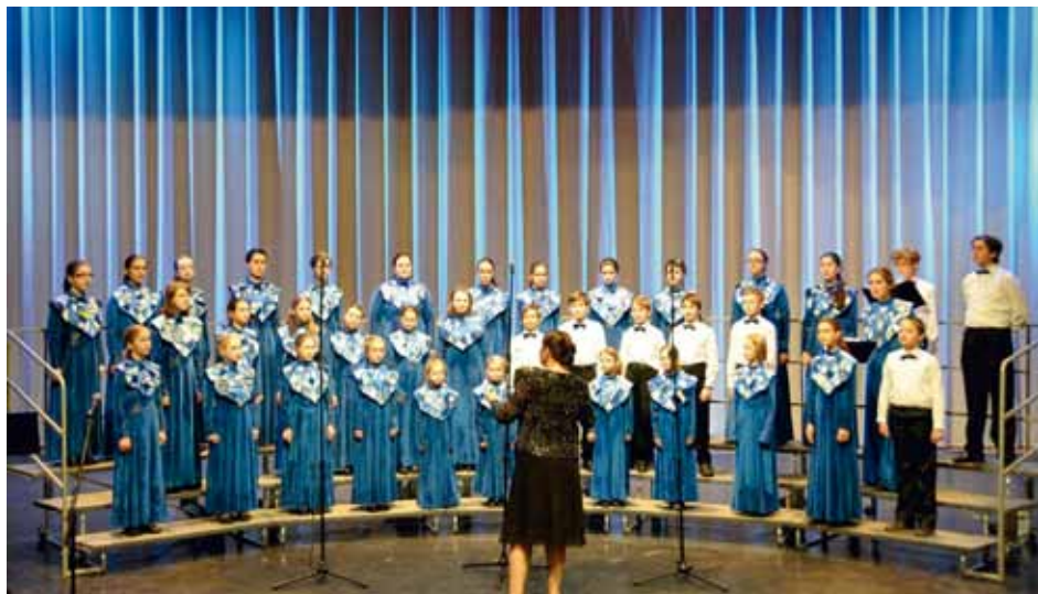
KHOR "MOSKOVSKIYE KOLOKOLCHIKI" MUSYKAL'NOY SHKOLY GNESINYKH Moscow, Russia