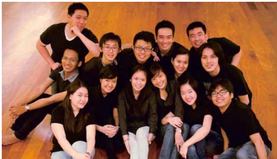
THE CHORALE SINGERS Jakarta Utara, Indonesia