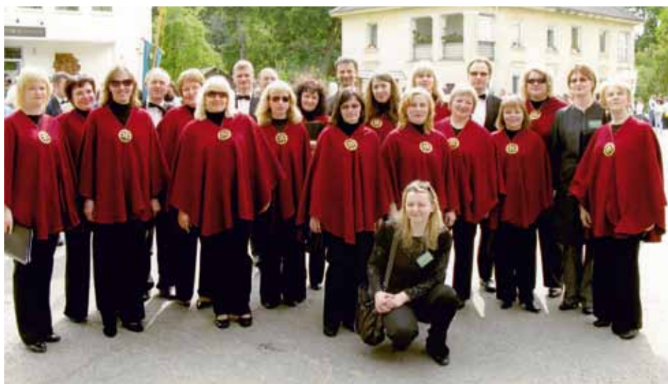
GAUSTAS Lazdijai, Lithuania