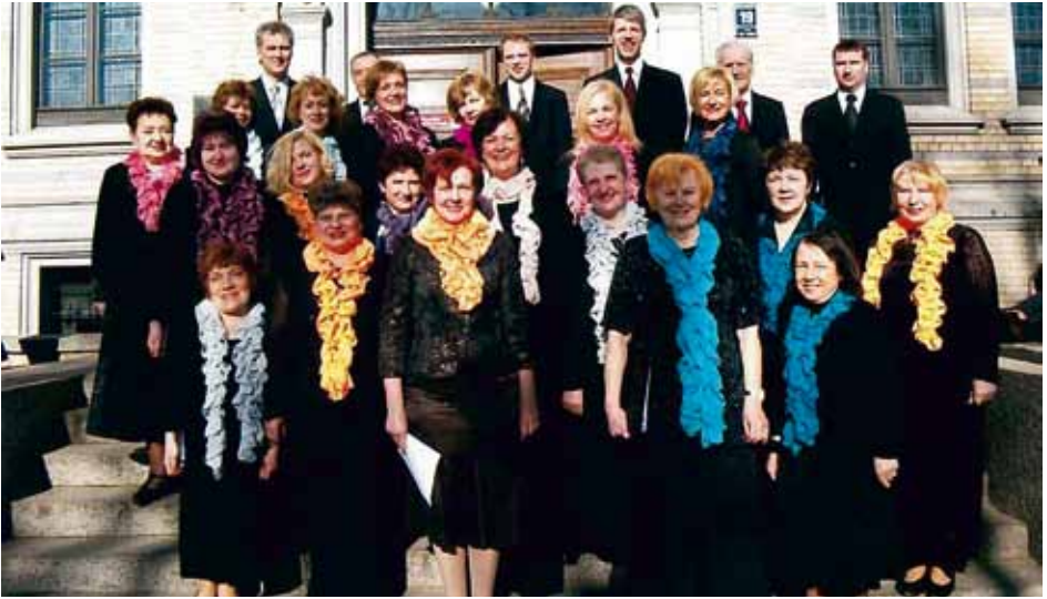
KAMERKORIS AMADEUS Riga, Latvia