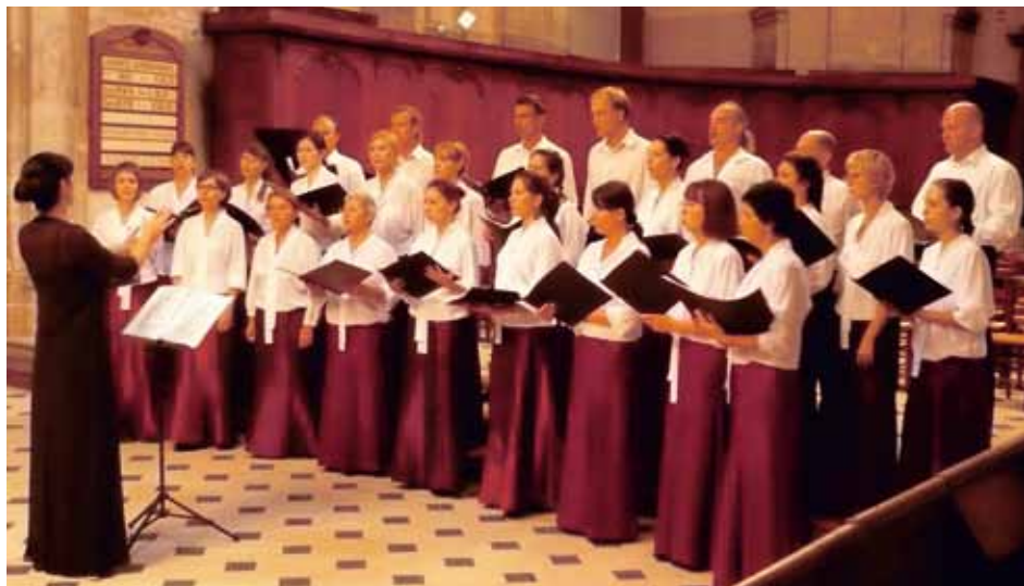
YOUTH AND STUDENT CHOIR FROM DUBNA Dubna, Russia