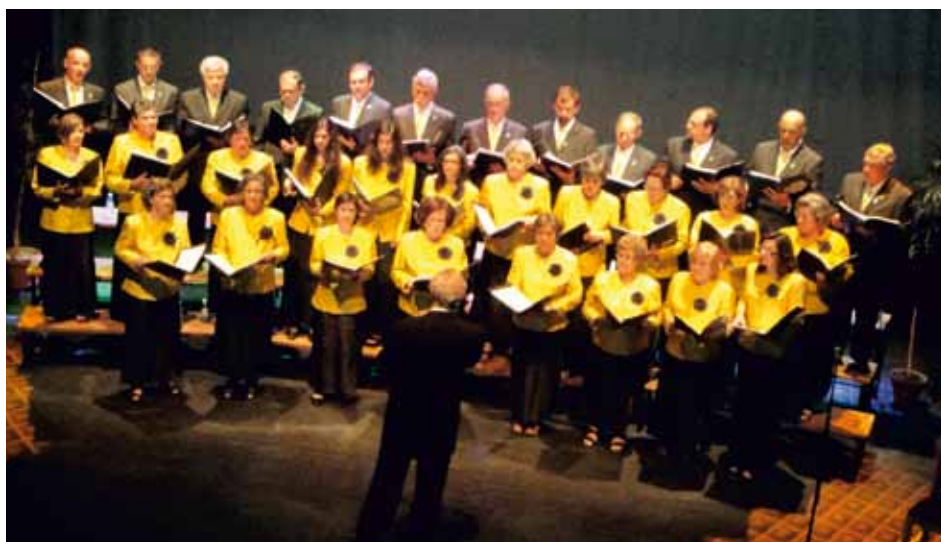
CORAL POLIFÓNICO DE PONTE DE SOR Ponte de Sor, Portugal