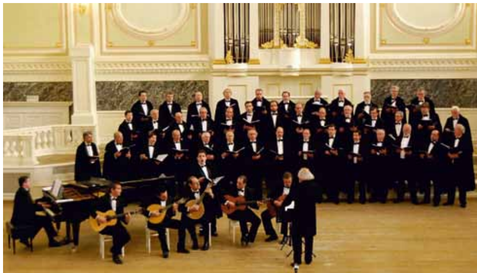
ANTIGOS ORFEONISTAS DA UNIVERSIDADE DE COIMBRA Coimbra, Portugal