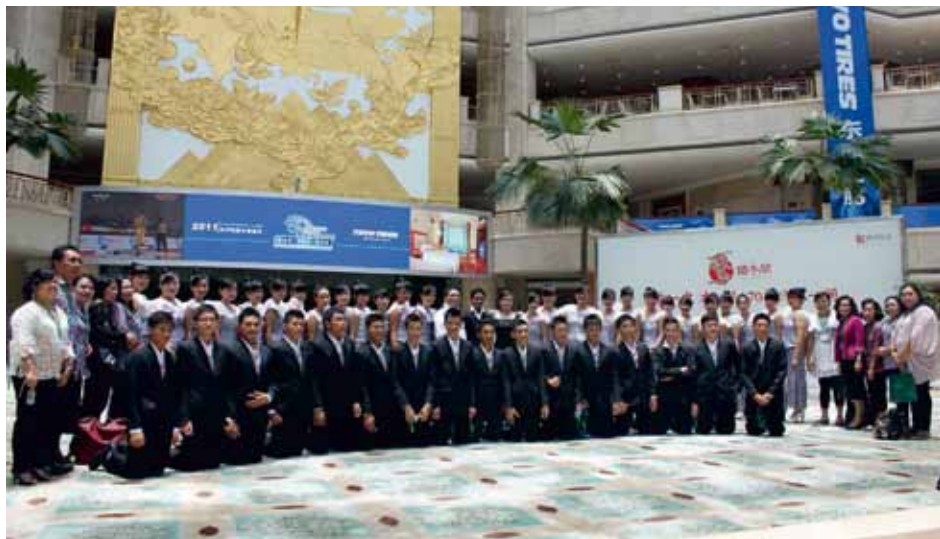
NINE'S VOICE SMA N 9 BINSUS MANADO Manado, Indonesia