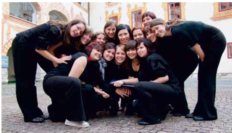
VOKALNA SKUPINA RADOST Godovič, Slovenia