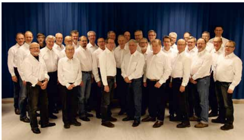
V NERSBORGS PAR BRICOLES MANSK R V nersborg, Sweden