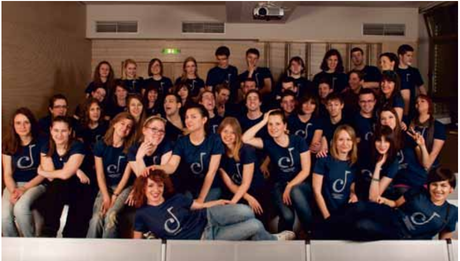
AKADEMSKI ZBOR FIL. FAKUL. U ZAGREBU "CONCORDIA DICORS" Zagreb, Croatia