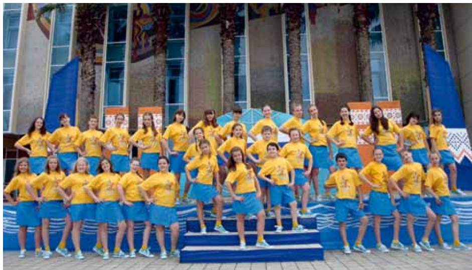
CHILDREN'S CHOIR "IMPROVIZATSIA" Bryansk, Russia