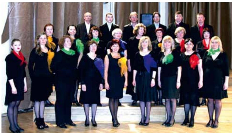
SEGAKOOR TULJAK Saku, Estonia