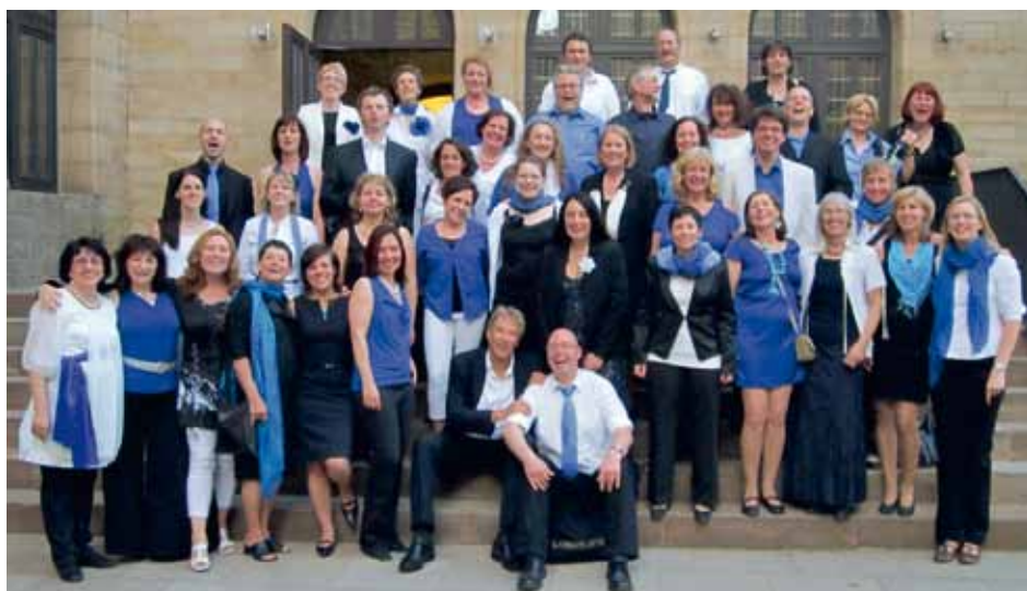
HEART CHOR Kaiserslautern, Germany