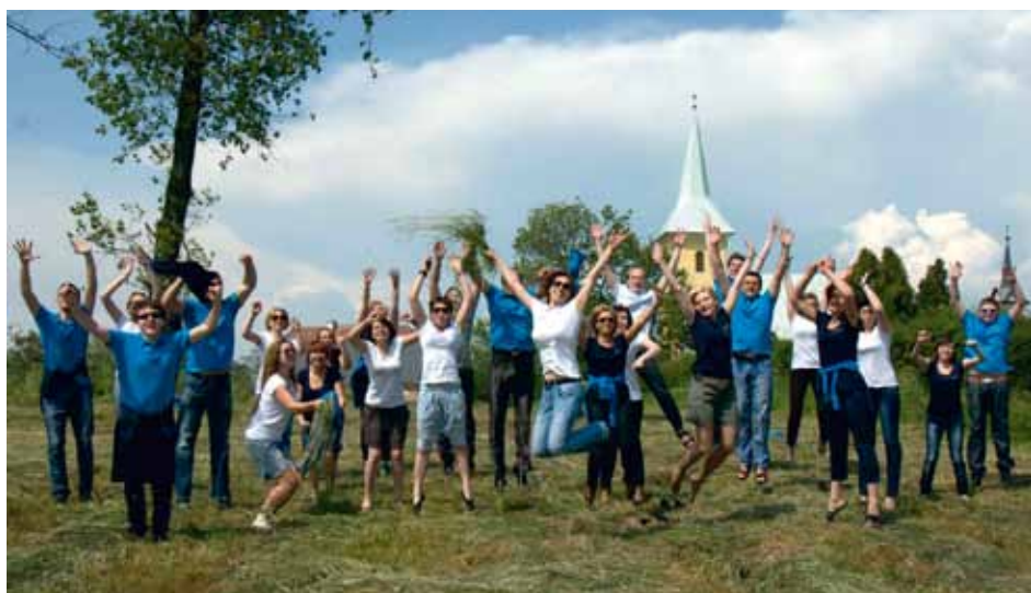
KŁODZKI CHÓR CONCERTO GLACENSIS Kłodzko, Poland