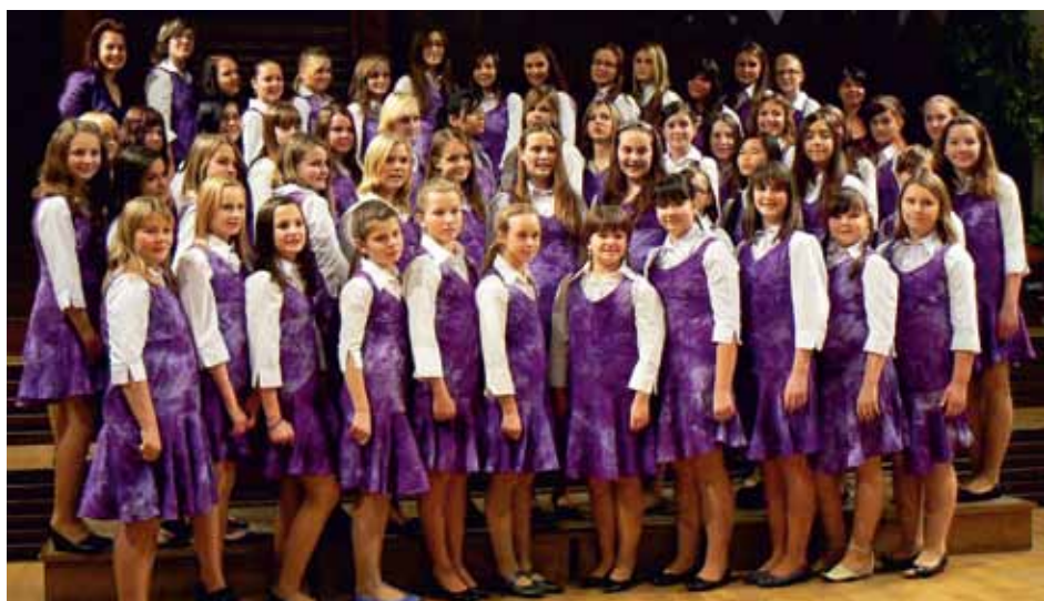
CARMÍNA České Budějovice, Czech Republic