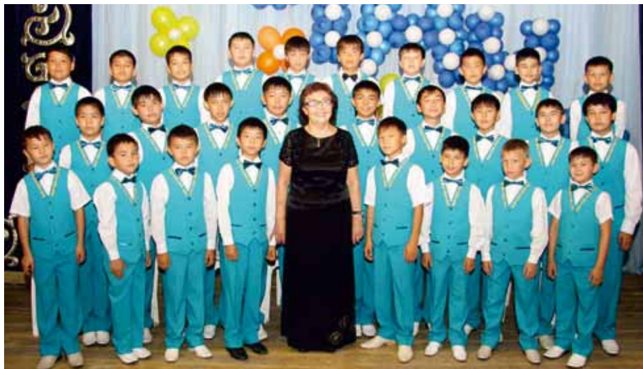
YER TOSTIK-MIRAS Almaty, Kazakhstan