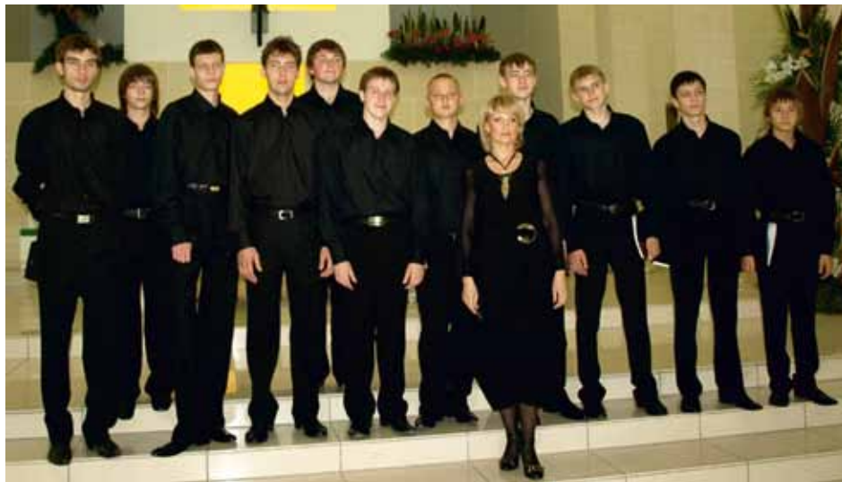
KRASNOYARSK FILARMONIC CHOIR OF BOYS AND YOUTH "CAPRICCIO" Krasnoyarsk, Russia