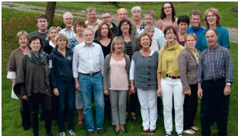
LERUMS KAMMARKÖR Lerum, Sweden