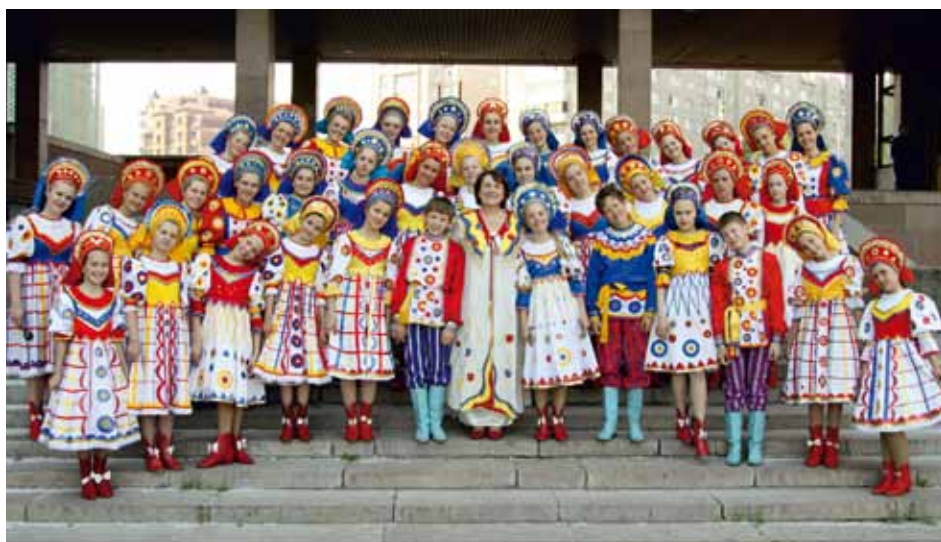
CITY CHILDREN'S CHOIR KRASNOYARSK Krasnoyarsk, Russia