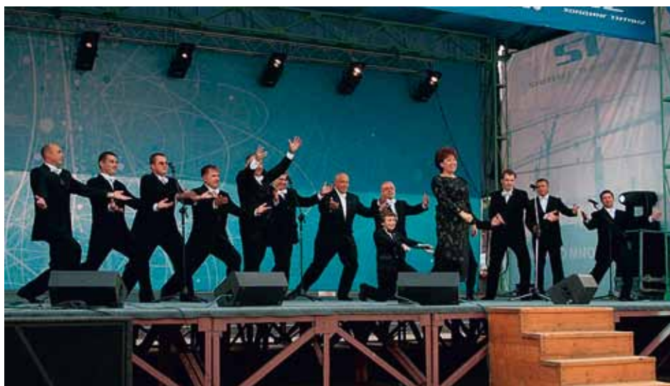
MUZHSKOI RAZGOVOR Sosnovyj Bor, Russia