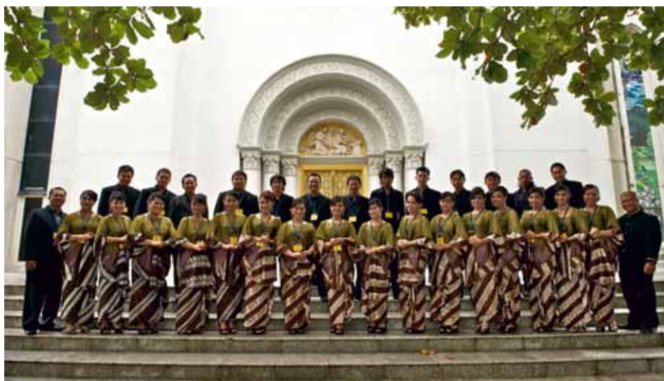
SOLA FIDE VOICE PALANGKARAYA Central Kalimantan, Indonesia