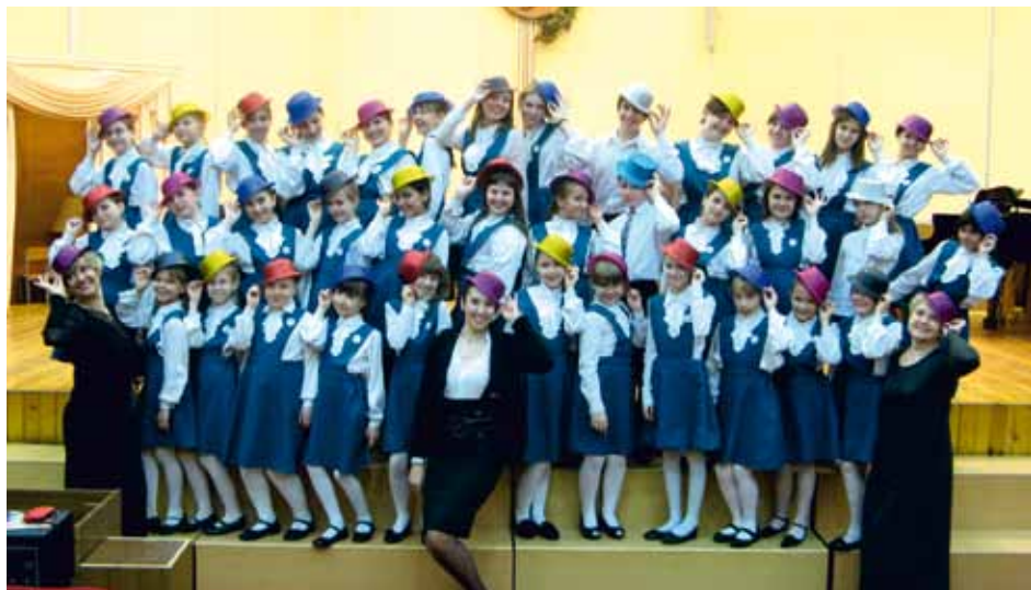
VIVAT Moscow, Russia