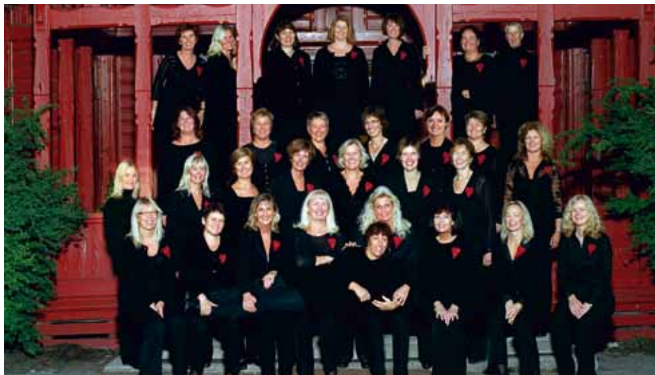
BEL CANTO VESTFOLD Sandefjord, Norway