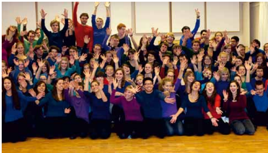
CANTAT UND IVOX BASEL Basel, Switzerland