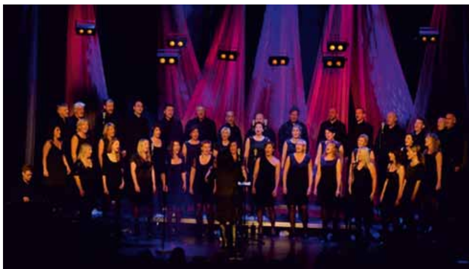
VON DESS Ålesund, Norway