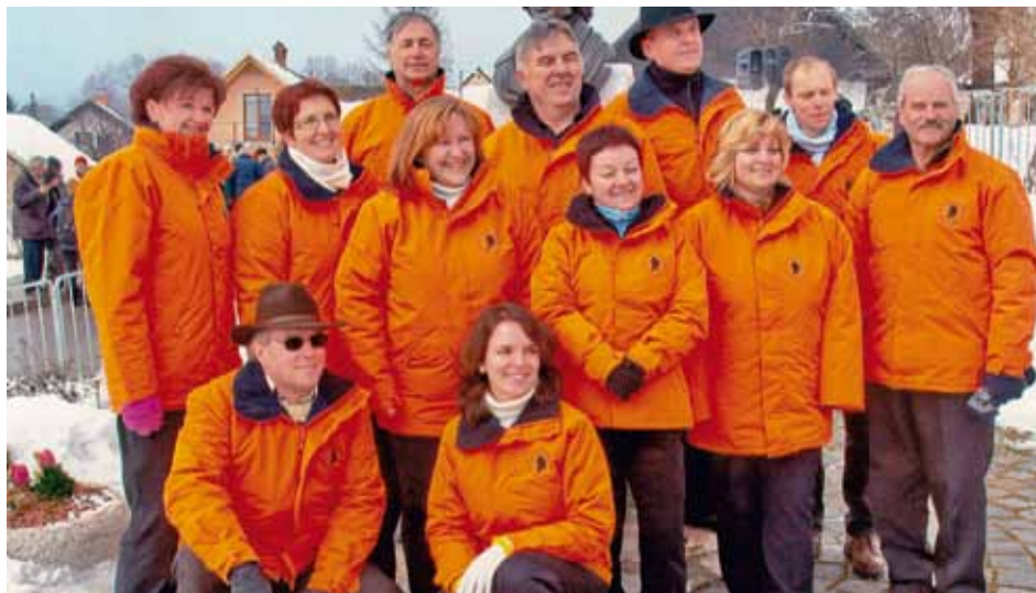
MEŠANA PEVSKA SKUPINA DR. FRANCE PREŠEREN ŽIROVNICA Zirovnica, Slovenia