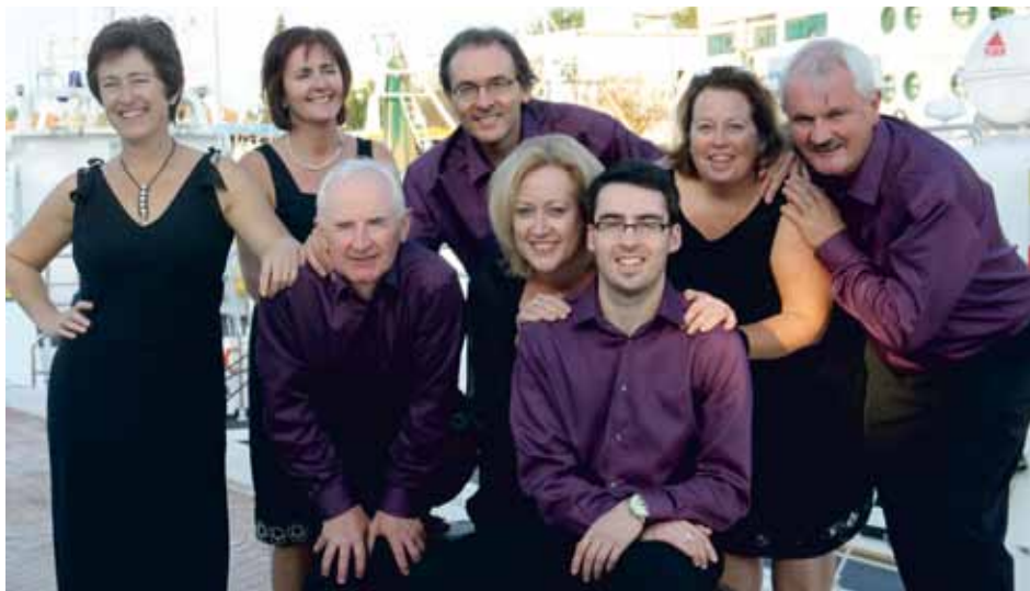
VALDA CHAMBER CHOIR Wexford, Ireland